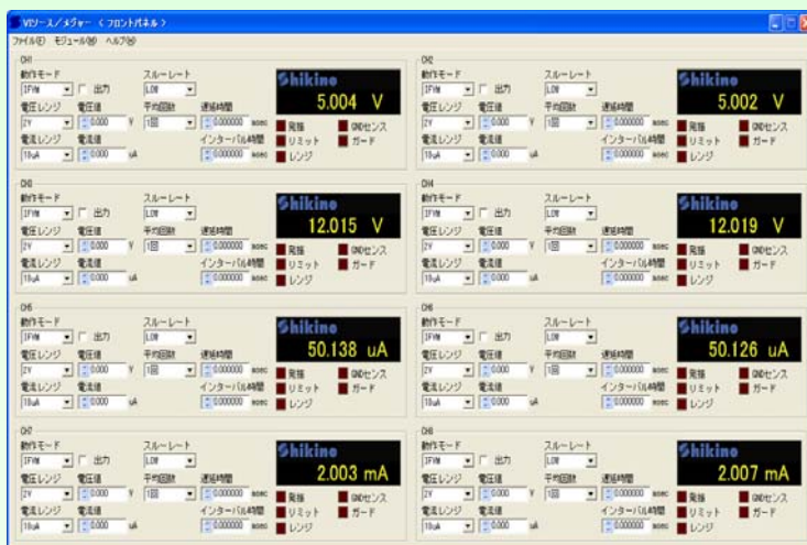
— サンプル画面 —