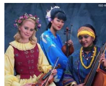
JIS標準画像(自然画像16種)の平均値 (対象画像：2560x2048 RGB24bit)